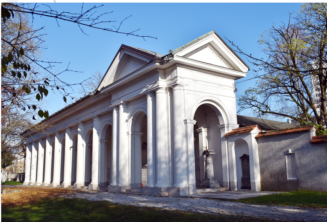
Slika 5: Jože Plečnik: Navje, Ljubljana, 1937–1938.

zel za ureditev parka slavnih, na podlagi česar je škof Rožman, po Plečnikovem nasvetu, sklenil mestni občini odstopiti vzhodni del nekdanjega pokopališča, ob klasicističnih arkadah (Stele 1940, 47–48; Mole 1940, 72; Piškur in Žitko 1997, 13). Na tem mestu so po Plečnikovih načrtih v letih 1937–1938 uredili spominski park Navje (Bajuk 1940, 1–2; Mole 1940, 72; Hrausky et al. 1996, 185; Piškur in Žitko 1997, 14–17). Hrbtenico novega projekta so zopet predstavljale obnovljene klasicistične arkade, ki so jih po arhitektovih načrtih na krajših stranicah odprli, s čimer so poudarili njihovo prehodnost. 15 Pod njih je dal Plečnik pokopati nekatere pomembne Slovencev, druge so pokopali v bližino arkad ali pa tja postavili le njihove nagrobnike (Mole 1940, 73). Okolico arkad je Plečnik parkovno uredil, nekaj nagrobnikov, med njimi grob svojih staršev, pa ohranil in situ . Park je na južni strani do-