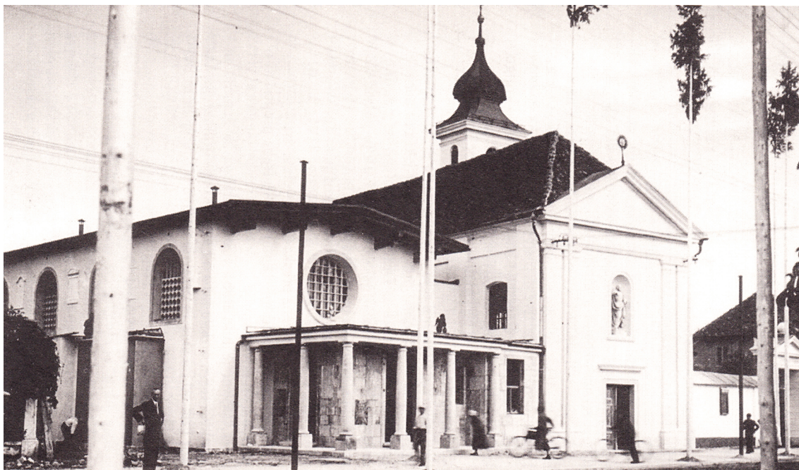
Slika 4: Jože Plečnik: Župnijska cerkev sv. Cirila in Metoda (prizidek cerkve sv. Krištofa), Ljubljana, 1933–1934, porušena 1957–1958 (po: Razbočan 1995).

Semenišče so pričeli graditi 1938 in ga do začetka druge svetovne vojne zgradili približno do polovice, v petdesetih letih pa po načrtih arhitektovega učenca Toneta Bitenca (1920–1977) le zasilno dokončali in namenili profanim funkcijam (Akademijski kolegij, Festivalna dvorana, Kino Soča, Pionirski dom, Mladinsko gledališče), dela so bila končana 1955 (Krečič 1992, 257; Hrausky et al. 1996, 179). Neposredno po začetku gradnje je prišlo do konflikta med arhitektom in vodjem gradnje, inž. Antonom Suhadolcem (1897–1983), ki je menda samovoljno spremenil nekaj detajlov, zato se je Plečnik načrtu odrekel (Krečič 1985, 115; Prelovšek 1992, 308; Krečič 1992, 157; Hrausky et al. 1996, 179; Prelovšek 2017, 367).