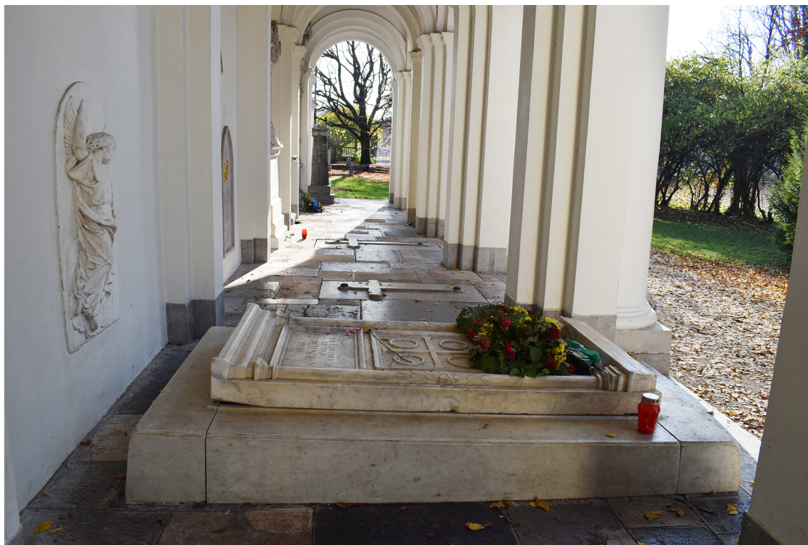
Slika 6: Jože Plečnik: Nagrobnik dr. Antona Korošča in dr. Franca Kulovca, Navje, Ljubljana, 1940.