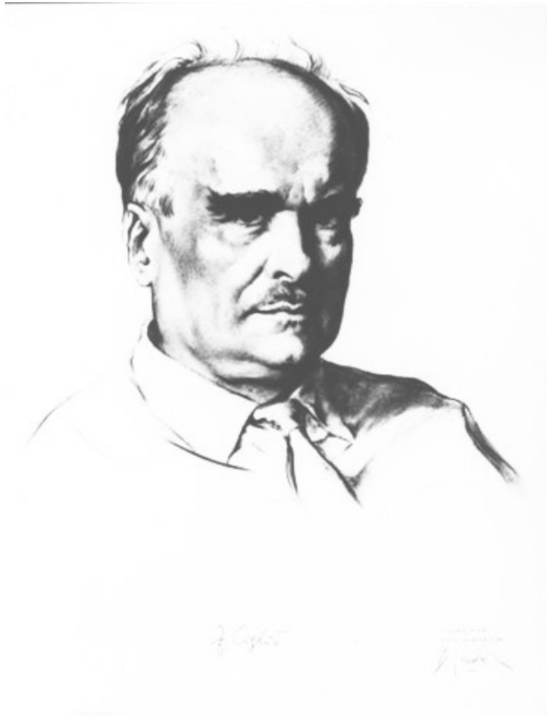
Slika 9: Božidar Jakac: Zvonimir Ciglič (sepija, 1975)

Cigličev celotni opus obsega le nekaj manj kot 80 del (pribl. 76), vendar pa dejstvo, da so med njimi simfonična in koncertna dela, balet itd., spremeni podobo te slike. 56 Zanj je prejel nekaj nagrad, priznanj in odličij: nagrado Prezidija Ljudske skupščine Republike Slovenije (1948), častni doktorat iz glasbe mednarodne univerzitetne ustanove Marquisa Giuseppa Scicluna (Malta 1987), nagrado mesta Ljubljane (1999) in Župančičevo nagrado (2003). 57