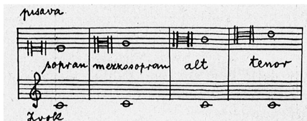
Slika 1: Razlaga c-ključev