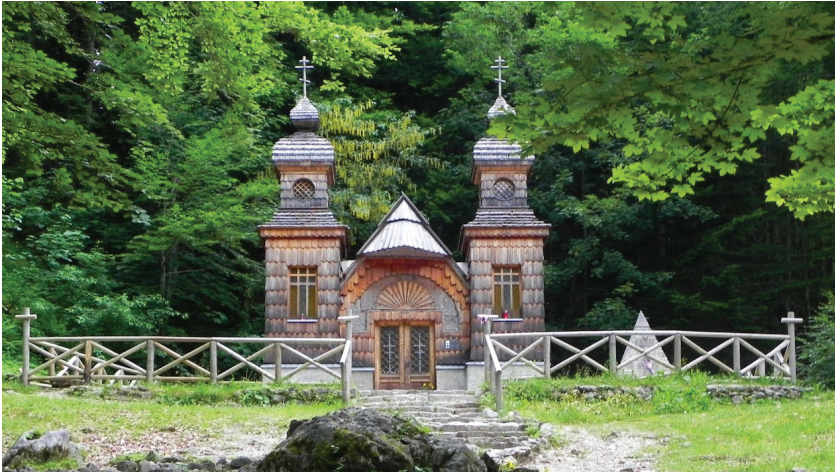
Slika 3.2 Ruska kapelica

Znaka evropske dediščine že omenjeni cerkvi Sv. Duha na Javorci leta 2018. 8 Leseni cerkvi, ki je izjemen sakralni objekt in arhitekturni biser, je bilo tako priznana še njena memorialna in civilizacijska vrednost.